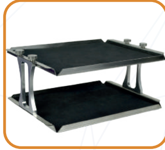
Çift katlı düz platform kaymaz kauçuk mat ile birlikte MP-RM-4D