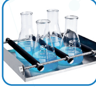
Universal platform Ayarlanabilir bar ile birlikte MUP-12