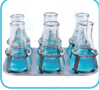
Erlen tutucu ile birlikte platform MP250-6