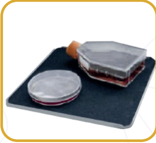
Düz platform Kaymaz kauçuk mat ile birlikte MP-RM-4