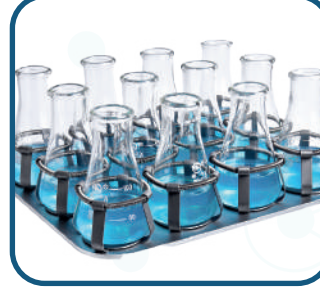
Universal platform Erlen tutucu ile birlikte platform MP100-12