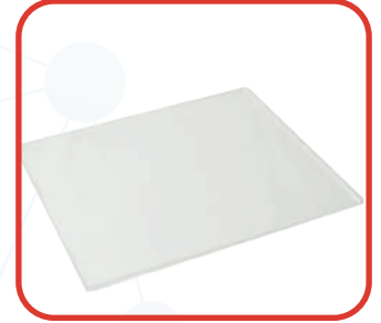
Yapışkan (Sticky) ped MSP- STC, MP-RM-4 yada MP-RM-4D ile birlikte MP-RM-4D